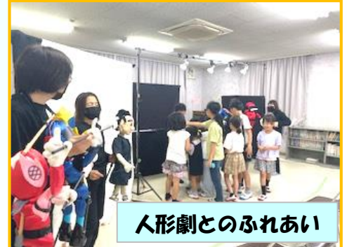
人形劇とのふれあい