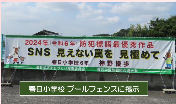
春日小学校 プールフェンスに掲示