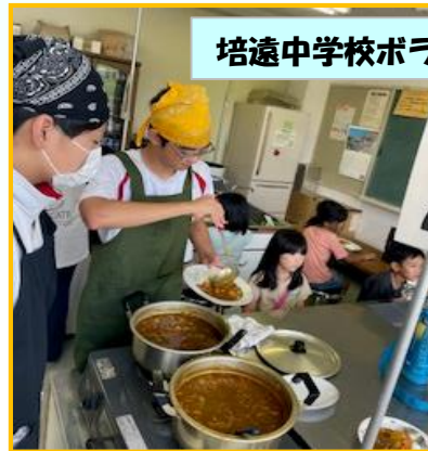
培遠中学校ボランティア 大活躍！