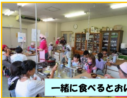
一緒に食べるとおいしいね♪