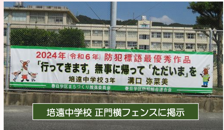
培遠中学校 正門横フェンスに掲示