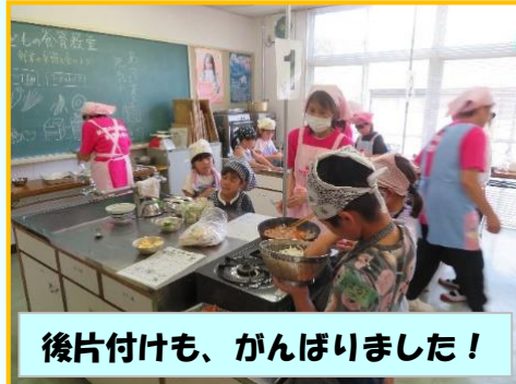
後片付けも、がんばりました！