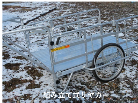
組み立て式リヤカー